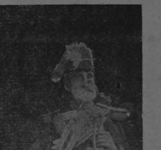
General don Víctor Guardia

En el golpe del 27 de abril de 1870, cuando fue derrocado el Presidente don