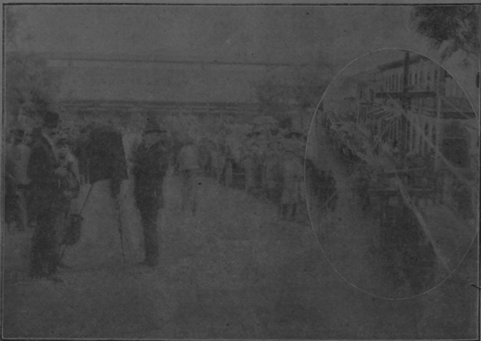
1. El público frente á la Estación esperando la llegada del tren.